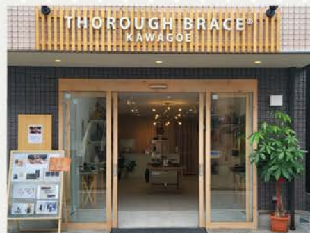
THOROUGH BRACE 川越

都営大江戸線または都営浅草線「蔵前」駅下車徒歩3分 JR総武線「浅草橋」駅下車徒歩12分