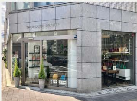
THOROUGH BRACE 蔵前 (本店)

〒111-0051 東京都台東区蔵前 4-21-10 1F 営業時間 09:00-18:00 (祝定休) tel. 03-5821-6627